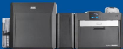
Oboustranná tiskárna / kodér s volitelnou laminací